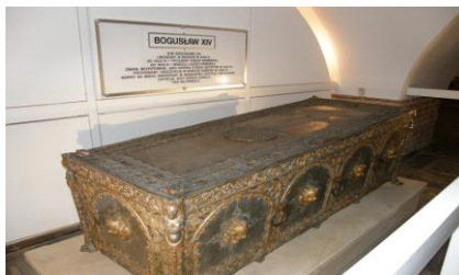
Sarkofag Bogusława XIV na Zamku Księżąt Pomorskich w Szczecinie

Nie znamy miejsc pochówku wielu przedstawicieli tej kaszubskiej dynastii. Jako przykład można wskazać miejscowość o obecnej nazwie Stolpe (Niemcy), która jest miejscem pochówku Warcisława I (protoplasta dynastii), czy Wołogoszcz (obecnie Wolgast w Niemczech). Z kolei w granicach historycznych Kaszub najważniejszą nekropolią jest Szczecin, gdzie na Zamku Księżąt Pomorskich znajduje się część ocalałych po II wojnie światowej sarkofagów, a w kościele św. Jakuba złożono w 1995 r. zachowane szczątki przedstawicieli rodziny panującej przez 500 lat na Pomorzu. Ponadto Gryfici byli chowani m.in. w katedrze w Kamieniu Pomorskim (nagrobki nie zachowały się do naszych czasów), kościele św. Jacka w Słupsku (zamek Księżąt Pomorskich, gdzie znajdują się ich sarkofagi) oraz Darłowie (miejsce spoczynku Eryka I – króla Norwegii, Danii i Szwecji).