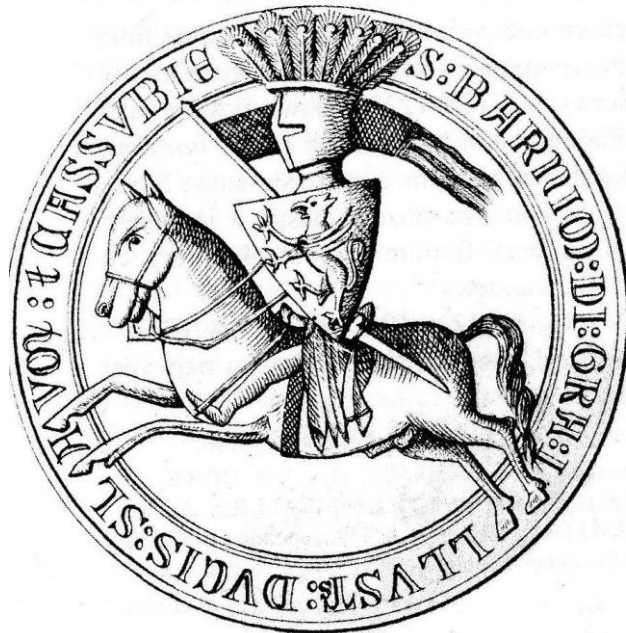
Pieczęć Barnima I z 1273 r.

dziadka wspomnianego księcia gdańskiego). Wraz z śmiercią księcia skończyła się też jedność państwa, gdyż jego synowie podzielili je na dwie części.